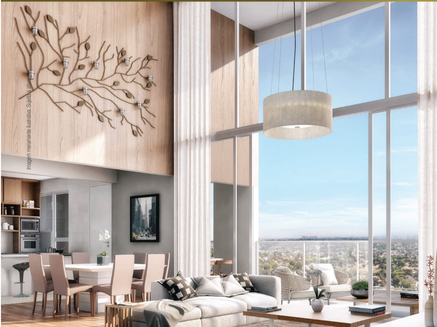
Perspectiva artística do living do apartamento de 189 m 2 com pé-direito duplo.

AGORA VOCÊ TEM UM MOTIVO A MAIS PARA IR A LIMEIRA. E QUE MOTIVO!