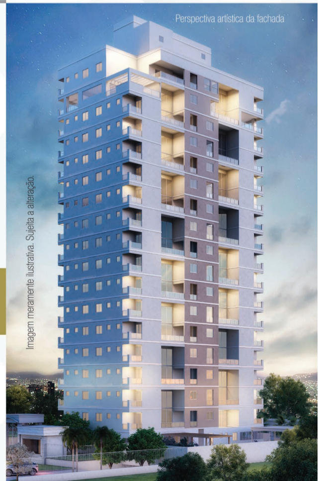
Perspectiva artística da fachada

Imagem meramente ilustrativa. Sujeita a alteração