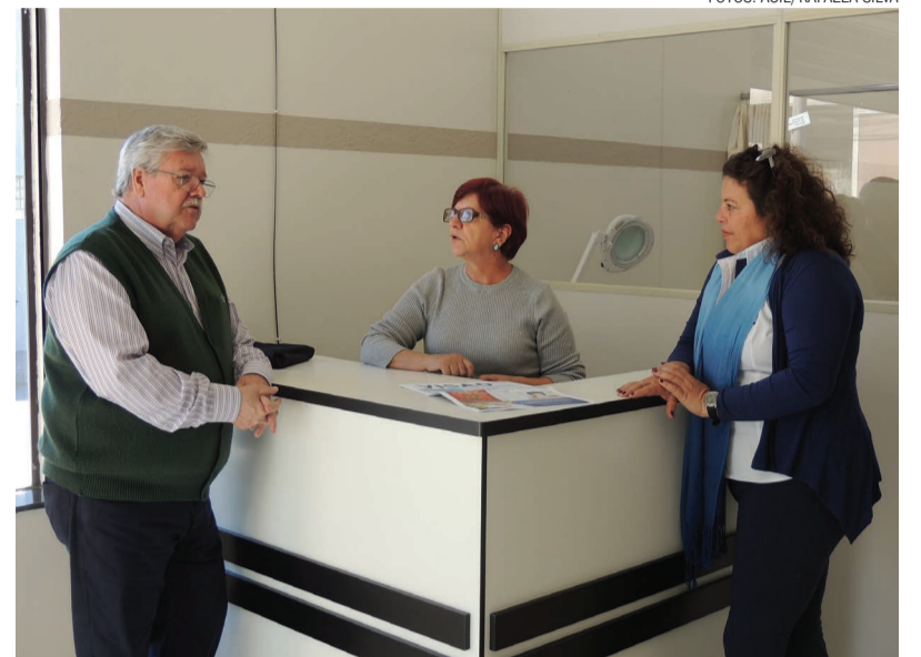
O presidente da ACIL esteve presente na ação e visitou alguns associados, como a loja da Depil Modas