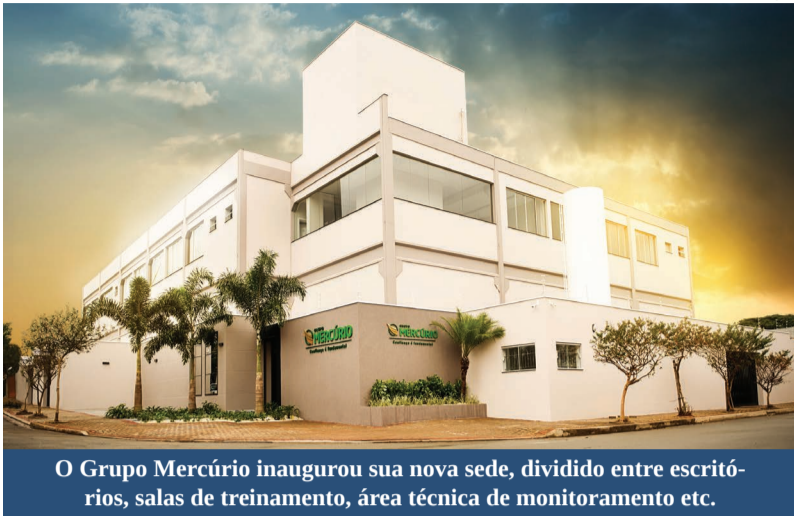
O Grupo Mercúrio inaugurou sua nova sede, dividido entre escritórios, salas de treinamento, área técnica de monitoramento etc.