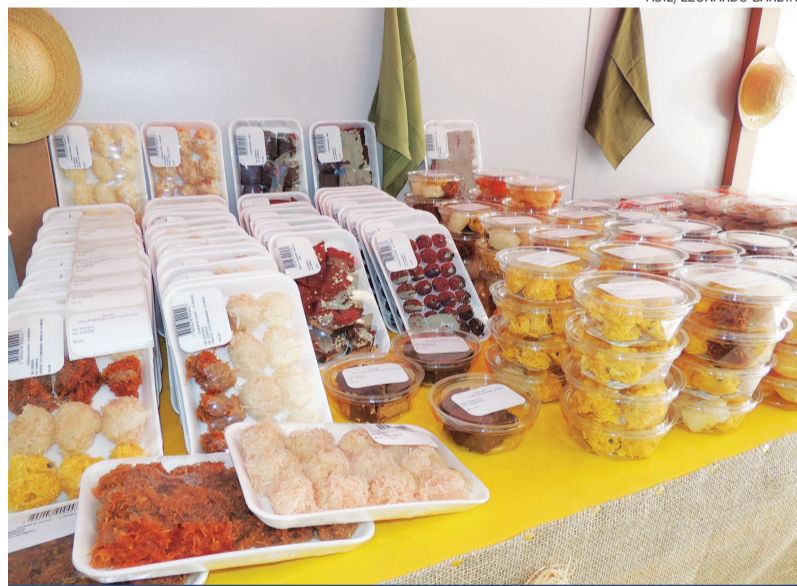
A empresa tenta resgatar a qualidade de doces típicos como cocadas, paçocas e o pé-de-moleque

Não só nos doces típicos, a Doces Vitória Plena está investindo em uma linha de doces gourmet, onde a mesma garante o sabor tradicional dos doces caseiros. “Isto garante uma linha de cremosidade e durabilidade maior, além de não serem açucarados como os tradicionais”, acrescenta o gerente. Ele também conta que a marca está com uma novidade, o Plenum. Este é um bombom de chocolate, que tem como recheio o pé de moça, hoje é o carro-chefe da empresa.